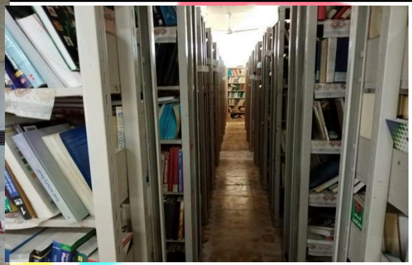
1. المكتبات المجانية (جامعة الفرات الأوساط التقنية، العراق)